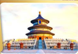
หอฟ้าเทียนจวน