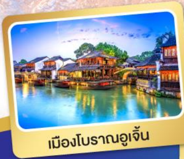
เมืองโบราณอู๋จิ้น