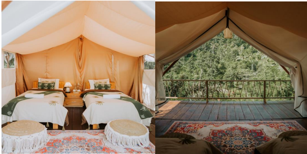
📍 อิสระรับประทานอาหารเย็น ด้วยตนเอง ณ รีสอร์ท