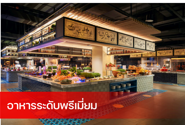
อาหารระดับพรีเมียม