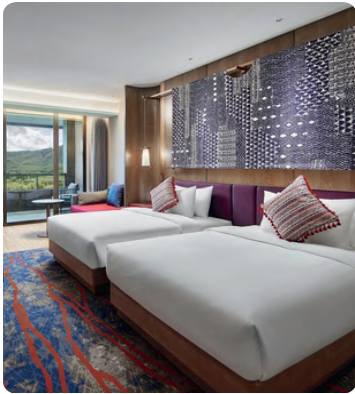
พักคลับเมดทุกคืน