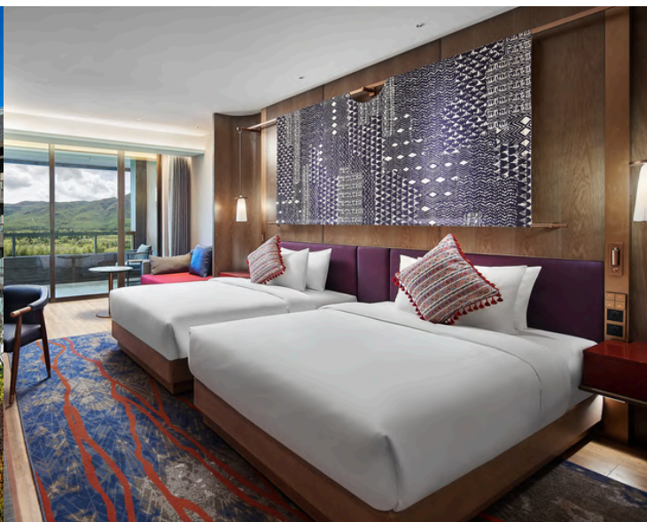
ห้องพัก Deluxe Room with View