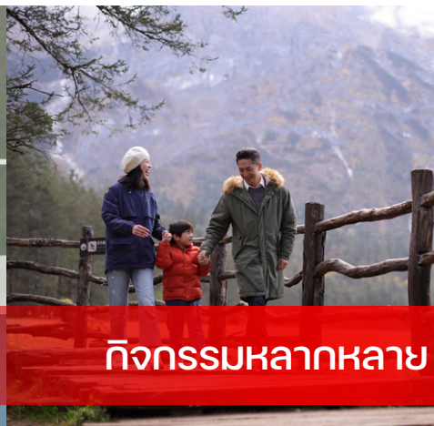
กิจกรรมหลากหลาย