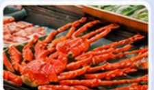
ตลาดปลาโมโตะ