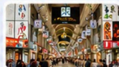
ถนนทานุกิโคจิ