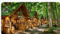
มิงเกิ้ลเทอเรส