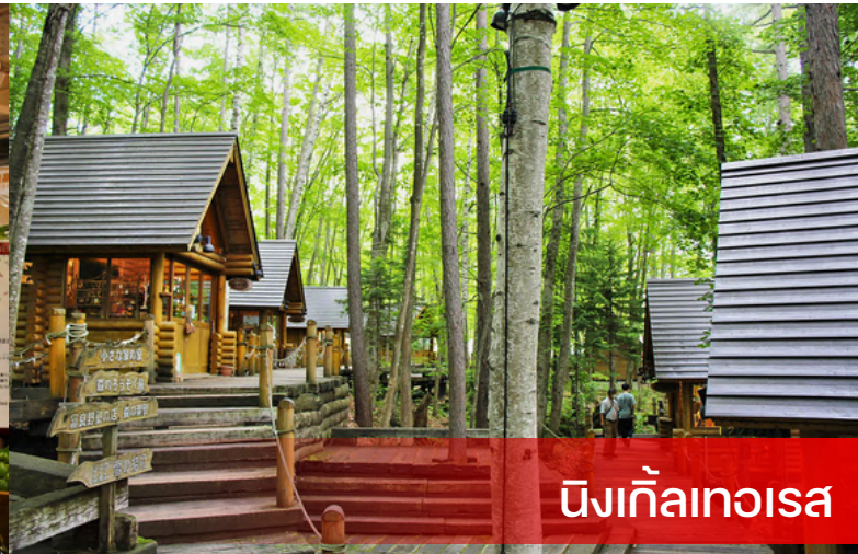
นิงเกิ้ลเทอเรส