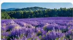
ฟาร์มโทมิตะ