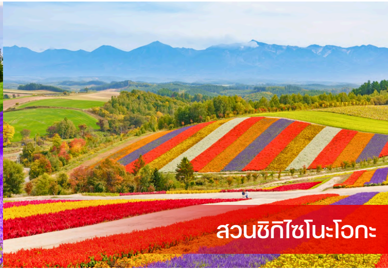
สวนซิกิไซโนะโอกะ

12.00 น. ลูกค้าอิสระรับประทานอาหารกลางวันตามอัธยาศัย เช่น สตรีทฟู้ดหรือซุ้มอาหารต่างๆ *มื้อกลางวันนี้ไม่รวมในแพ็คเกจ