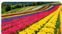
สวนฮักโซโนะโอกะ