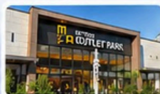
มิตซึย เอต์ลิต พาร์ค